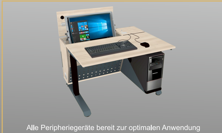
Alle Peripheriegeräte bereit zur optimalen Anwendung

großzügige Ablagefläche vor dem Fachbildschirm für beste Positionierung von Tastatur, Mouse und Vorlageblättern