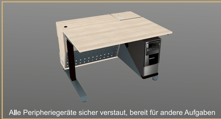
Alle Peripheriegeräte sicher verstaut, bereit für andere Aufgaben