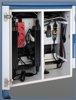
Revisionsöffnung und Verkabelungstechnik

Mediencontainer mit integrierter Mittelwand, zur Trennung der signalführenden Kabel und der 230-Volt-Verkabelung (auch im Revisionsfach und horizontalen Stahlblechkabelkanal getrennt), in der Bodenplatte zwei Kabeldurchlässe, z.B. zur Kabeleinführung aus dem Fußbodenkanal